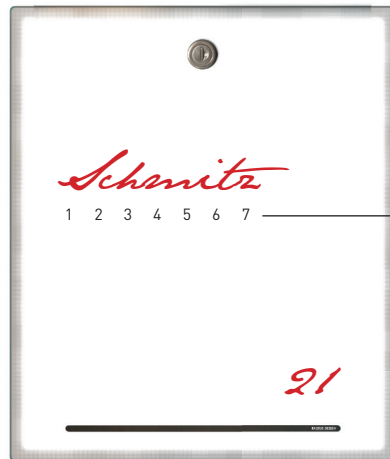
groß / large 123a