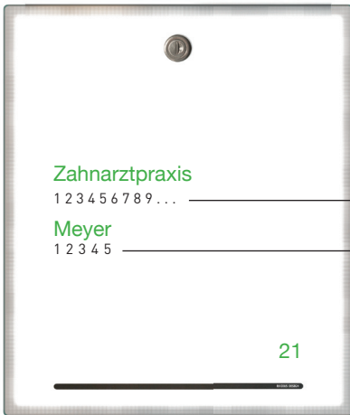
klein / small 123c