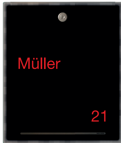
groß / large 123f